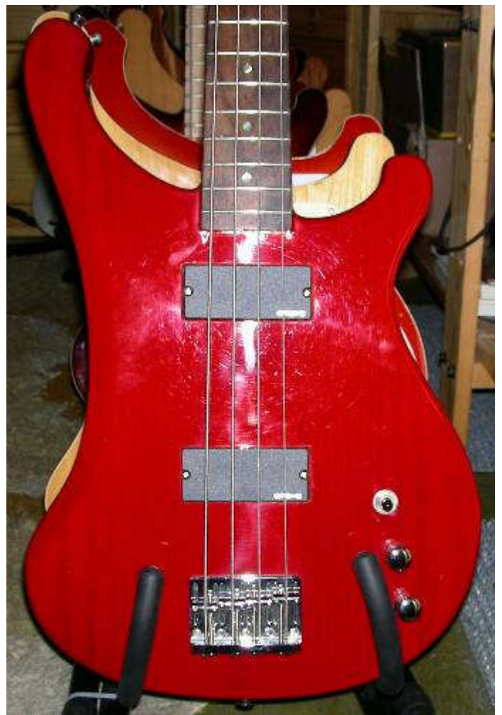
Die 3. Version mit Binding :