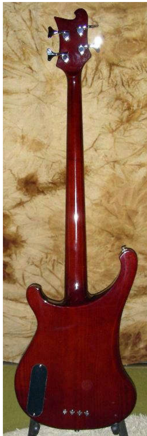
Das RBB steht bei B&Ch übrigens für River Boat Bass . . .