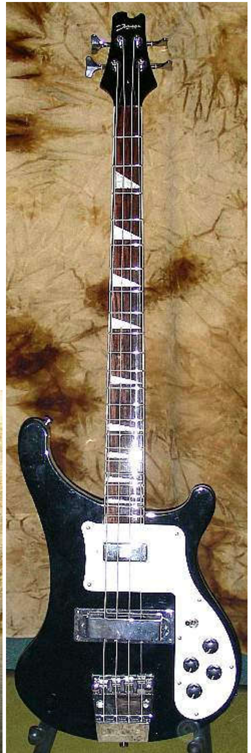
Johnson Special Edition mit S.Duncans