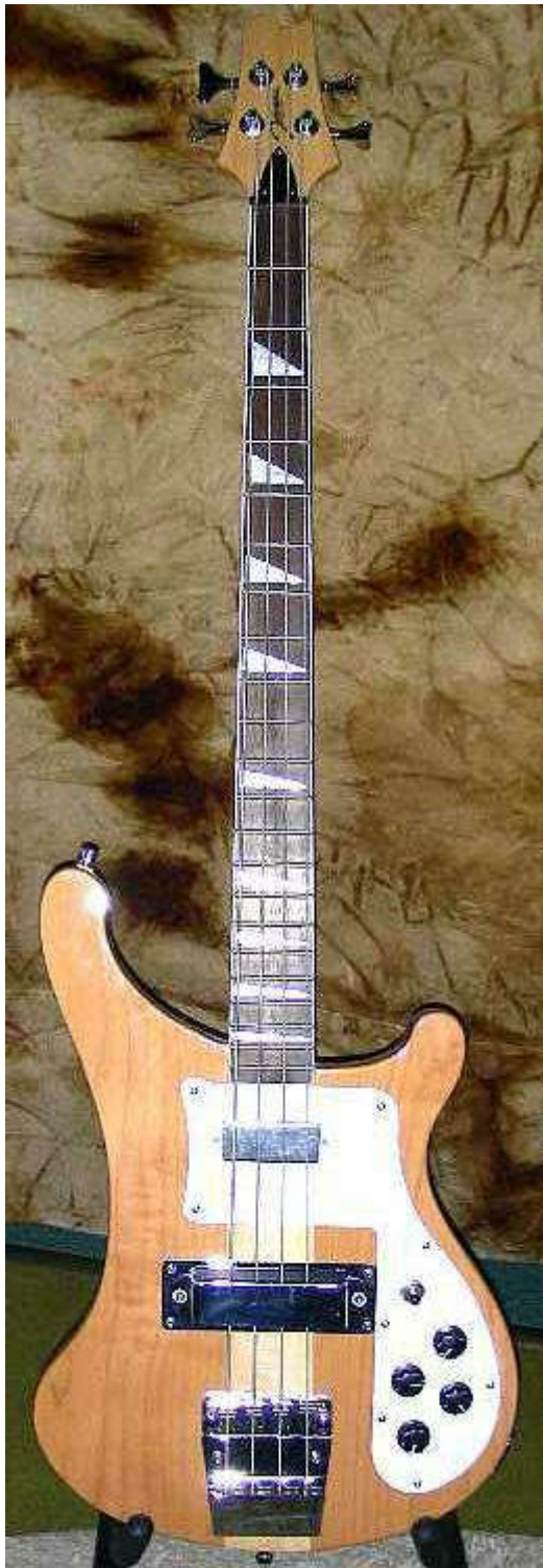
Johnson JP-R NT