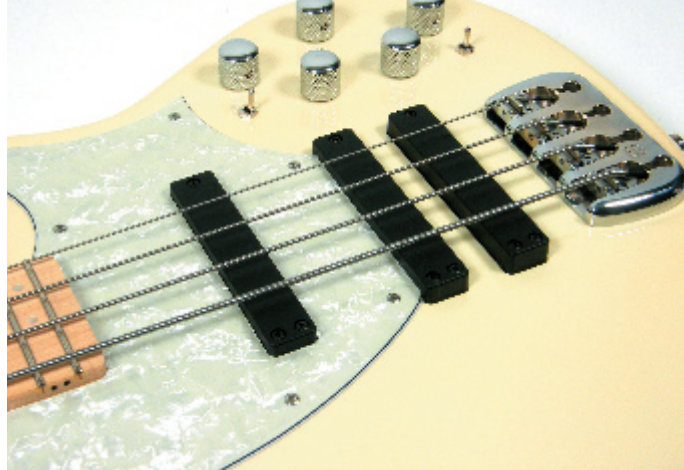
Drei Pickup-Positionen beschern fein unterschiedliche Timbre-Varianten.

Pickup und zwei Steg-Tonabnehmern macht den Zugang leicht: Per Überblendregler stellt man wie gewohnt die Balance zwischen den bassigeren und den knorrigeren Pickup-Sounds ein. Dabei verwaltet ein dreistufiger Kippschalter die Klangmöglichkeiten des Steg-PU-Paares, wobei beide Einzeltonabnehmer angewählt oder parallel geschaltet werden können. Wenn mehr Power von diesem Pickup-Paar verlangt wird, kann an einem zweiten Kippschalter die Serienschaltung abgerufen werden. Dass hier zwei Schalter für die beiden Steg-PU's zuständig sind, erscheint auf den ersten Blick umständlich. Aber darin steckt die praktische Möglichkeit, sich einen Steg-PU-Sound für den normalen Gebrauch einzustellen, und am Power-Schalter unkompliziert Gas geben zu können, wenn man es braucht.