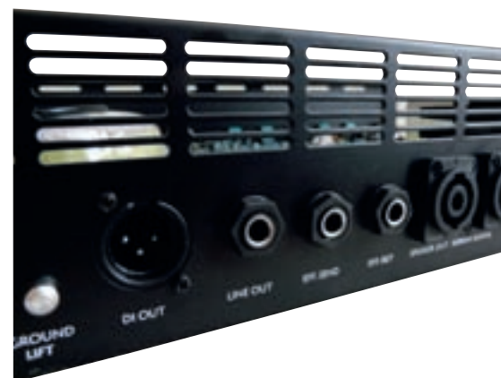
Eine Vielzahl an Anschlüssen: Die Kehrseite des Basstops.