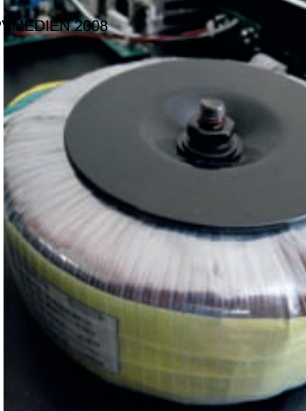
Immer Leistung satt: Der fette Trafo des HB3000BT.

nämlich auch eine für diese Preisklasse außergewöhnliche Mittenparametrik , bestehend aus Mid-Sweep-Regler und Sweep-Level. Kompliment an die Entwicklungsabteilung: Gut mitgedacht.